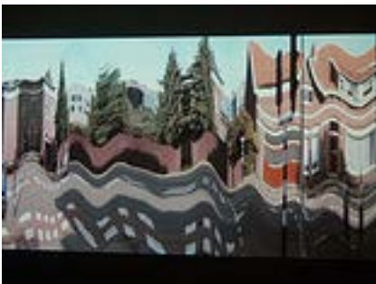
Still uit Eindhoven van Herczka.

Speciaal onderdeel van de Open Data expositie was de vertoning van het werk Eindhoven door Matheusz Herczka in de hal van het Stadhuis.