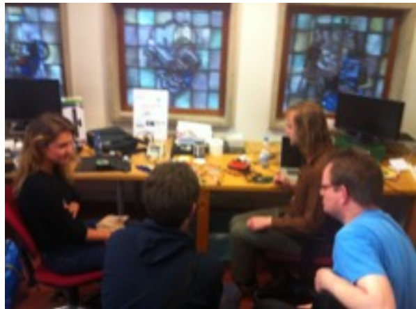
werkbepreking ontwikkeling prototype

De huisvesting van MADlab in de voormalige Schellensfabriek is een uitstekende locatie gebleken om de organisatie te faciliteren. Qua podia waarop MAD kan presenteren is er samengewerkt met TAC, Stadhuis, Bibliotheek, Fontys en Natlab.