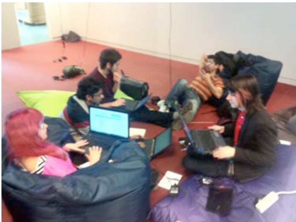
Team in actie tijdens Hack the Future.

http://www.meetup.com/LSEHVMG/events/85452212/