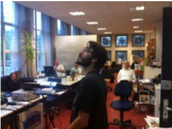
workshop open source software in madlab

Grote successen waren de realisatie van het Nationaal Congres Open Data, met verbonden expositie van datavisualisaties en info graphics; de Science Hack Day Eindhoven tijdens de Dutch Technology Week; de start van het programma Play the Future in de Bibliotheek en de Nerdlab expositie in drie Brabantse steden, waarbij in Eindhoven in het TAC de Brain Battle als onderdeel van Play the Future plaatsvond.