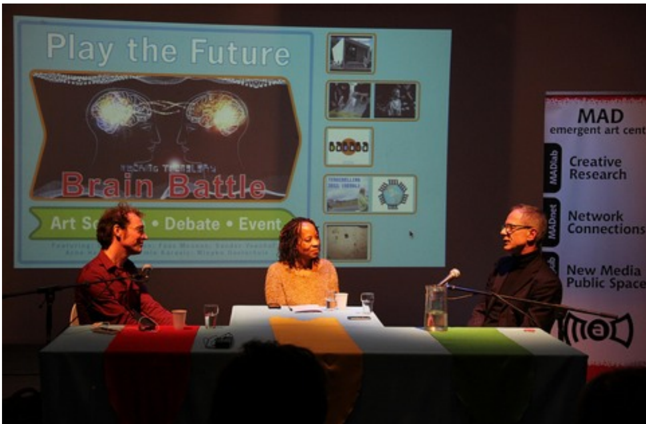
Fragment van de Brain Battle discussie tussen wetenschapper en kunstenaar.