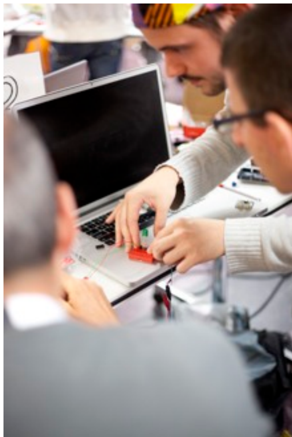
Deelnemers aan de Science Hack Day Eindhoven.