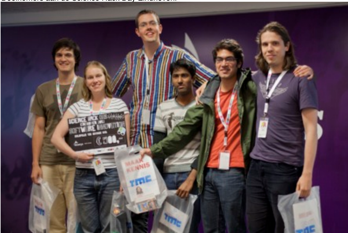
Een groep internationale studenten die in de prijzen vielen.