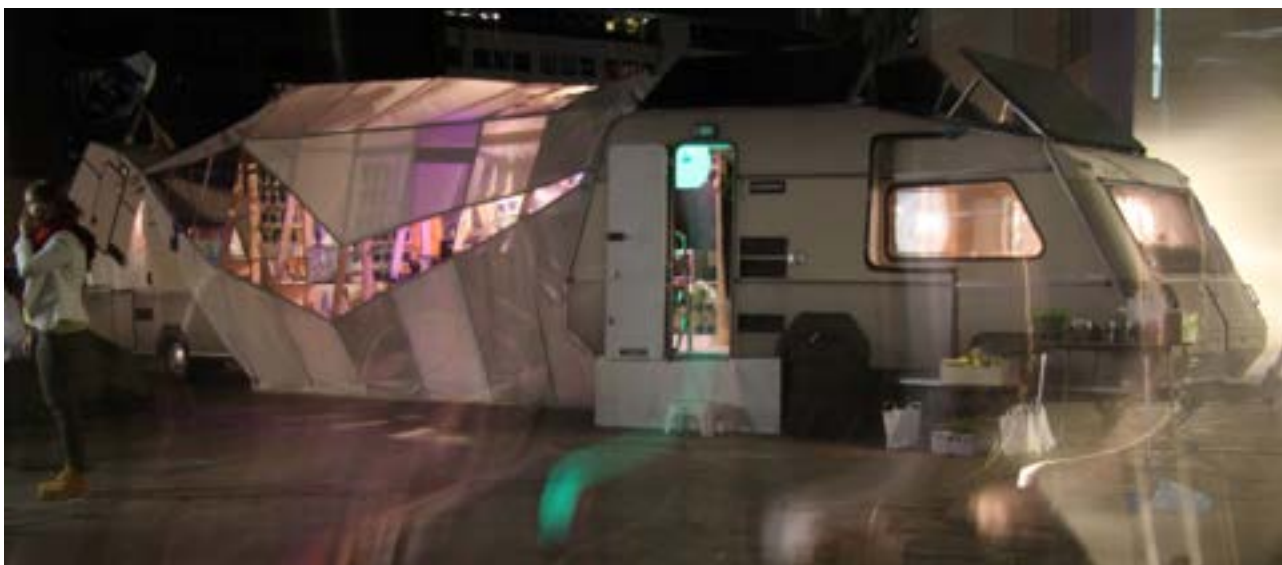
Seeker [EH3] van Angelo Vermeulen

Ook de Dutch Design Week werd weer een enerverende periode waarin MAD zowel het Play the Future event als de PolderHack produceerde. Opmerkelijk resultaat: een DIY ruimtestation op het Lichtplein!